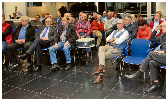
Interessiert folgten die Zuhörer den drei Referenten bei ihrer Präsentation innovativer Lösungen in der umweltschonenden Motorentechnologie.